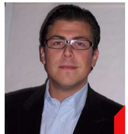
Frenche Real Estate, siège social 6 Place de la Madeleine 75008 Paris 8ème contact@frenchreal.fr

Je voulais que l'on avance dans le réalisme et c'est réussi ! Il y a de la vie. La lumière est régulière et met bien en valeur l'architecture du bâtiment. Le travail est très abouti.