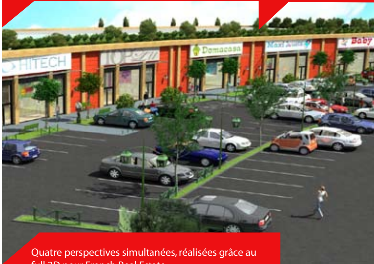
Quatre perspectives simultanées, réalisées grâce au full 3D pour French Real Estate

virtuelle depuis un point fixe à partir duquel le regard pivote jusqu'à 360° pour obtenir un aperçu de l'espace).